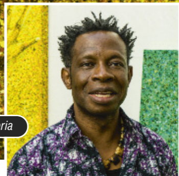
Artwork: Chidi Kwubiri, Nigeria

Ich bin – weil du bist Ich Mit meinen Charismen Meinen Fähigkeiten Meinen Stärken Meinen Schwächen Du Mit deiner Geistkraft deiner Stärke deinem Lebensatem deiner Barmherzigkeit Ich Im Leben Manchmal aufrecht Manchmal gebeugt Manchmal voller Energie Manchmal resigniert Manchmal echt und ehrlich Manchmal feige und schuldbeladen Du Das Leben Die Auferstehung Der Gekreuzigte Der Sinn Der Halt Die Wahrheit Der Neubeginn Ich bin – weil du bist Aus dir lebe ich Von dir gewollt und gerufen Mit dir beginnt alles Mit dir endet alles Mit dir will ich auf-er-stehen zu einem neuen Leben Diesen Weg gehe ich in Vertrauen, denn: Ich bin – weil du bist. Andreas Paul zum Misereor-Hungertuch