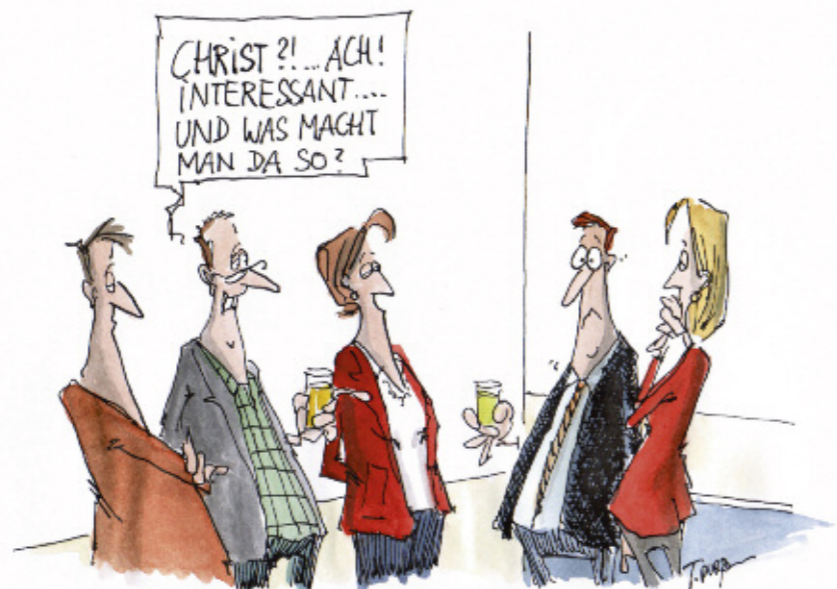
Cartoon: Thomas Pfaffmann