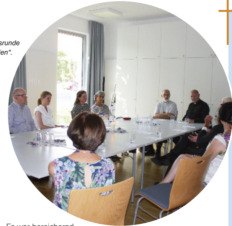
Weihbischof Ansgar Puff in einer Diskussionsrunde des Projektes „Glauben teilen“.

der Ahr gewandert und nach Rezepten der Bibel bzw. indisch gekocht. Es war ein sehr vielfältiges Angebot, das für alle offen sein sollte, die Interesse an Gesprächen haben und das Interesse für Glauben und Kirche wecken sollte.